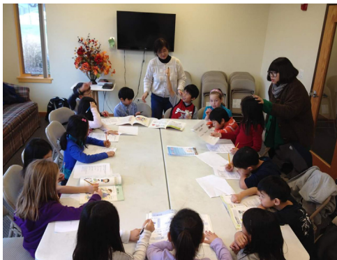
〈파라과이 엔카한글학교, 2015.08.29〉