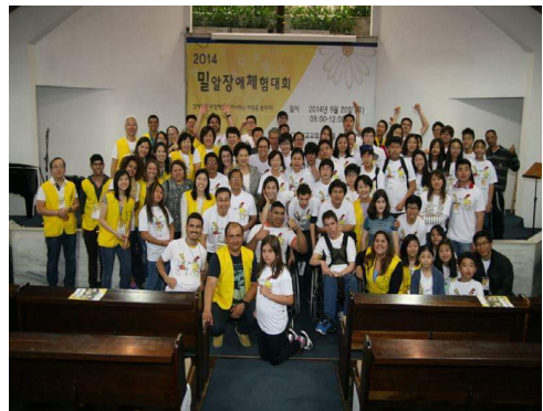
〈브라질 상파울루 밀알한국학교, 2015.08.20〉