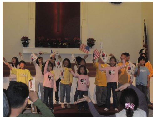
〈미국 LA 오렌지카운트 영락한국학교, 2015.09.12〉