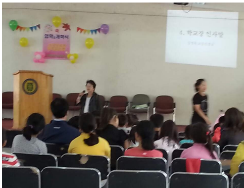
〈몽골 토요한글학교, 2015.09.11〉