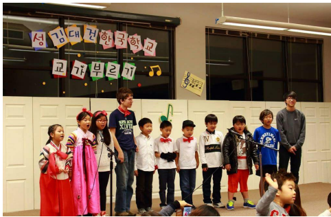
〈미국 시애틀 성김대건한국학교, 2015/09/25〉