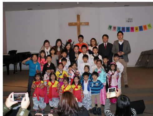
〈뉴욕 새한국문화학교, 2015.09.25〉