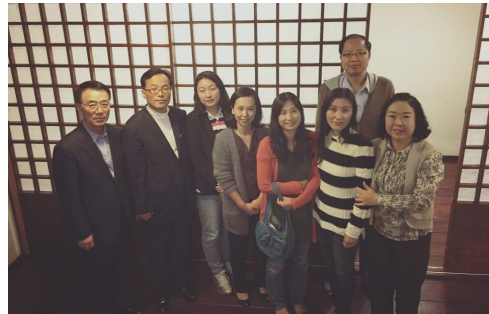
〈멕시코시티 한글학교, 2015.11.07〉