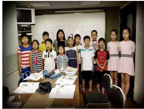
〈중국 북경 우리말학교, 2015.09.02〉