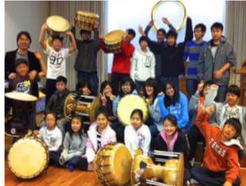
〈뉴욕의 원광한국학교, 2015.09.25〉