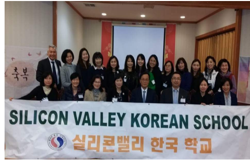
〈미국 실리콘밸리 한국학교 교사 및 임직원, 2015.09.10〉