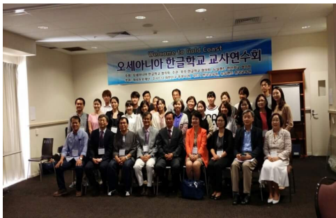
〈오세아니아 한글학교 교사연수회, 2015.10.04〉