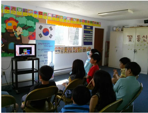
〈시애틀 꽃동산한국학교, 2015.09.09〉