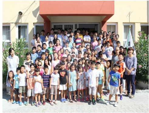
〈터키 이스탄불한글학교, 2015.09.08〉