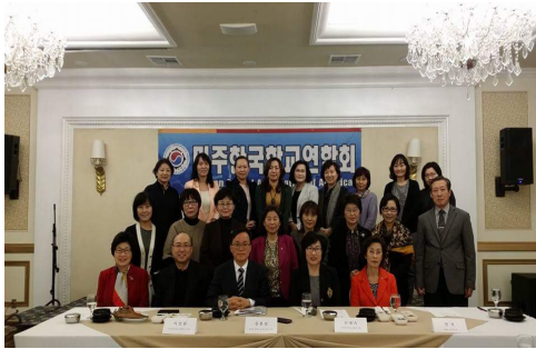
〈미주 한국학교연합회 임원들, 2015.09.12〉