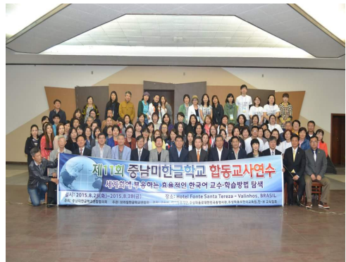
〈중남미한글학교 합동교사연수, 2015.08.25〉