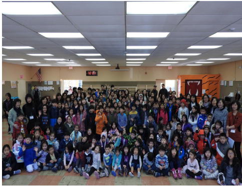
〈뉴저지한국학교 2016년 봄학기 개학〉