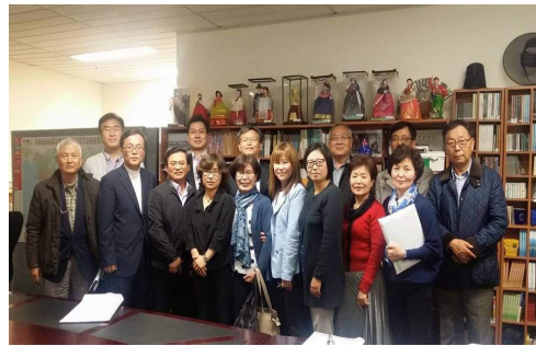
〈시드니 한국교육원 임직원들, 2015/10/01〉